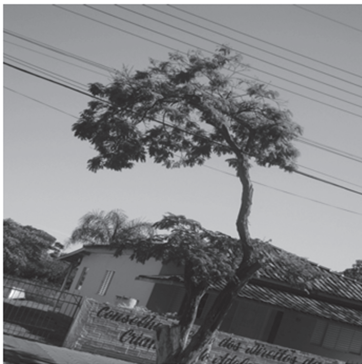
Figura 2. Conflitos existentes entre as arbóreas e a rede elétrica que teve como consequência poda irregular.

O recuo mínimo permitido entre o colo da árvore e a face interna do meio é de 50 centímetros, de acordo com esse dado apenas 3,97% não se encaixaram nesse aspecto, 88,74% estão dentro e acima da medida permitida e 7,28% é a porcentagem de árvores que estão localizadas em áreas da avenida que não tiveram pavimentação asfáltica. A distância mínima do colo da árvore até o muro é de 1,20 metros, sendo necessária para que ocorra a passagem de pedestres e cadeirantes, todas as árvores analisadas estão dentro da faixa permitida. (SEMA/UBERABA-MG).