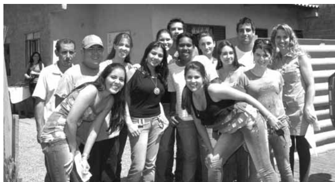
Figura 15 – Equipe de 2008 / Casa entregue em 2008