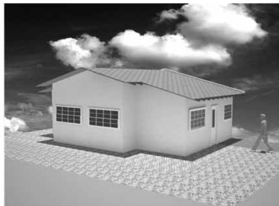
Figura 6 – Perspectiva da casa de 2008