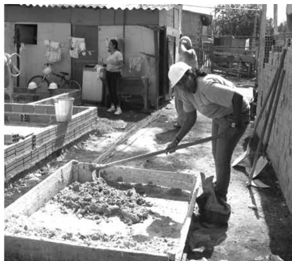
Figura 12 – Confeção de argamassa