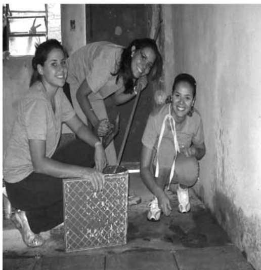
Figura 13 – Assentamento de cerâmica