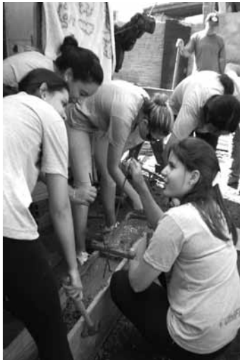
Figura 9 – Concretagem dos baldrames

Os próprios alunos é que colocaram a “mão na massa”, e acompanharam a execução do início ao fim até a cerimônia da entrega das chaves. (Figuras 9, 10, 11, 12, 13 e 14)