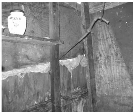
Figura 4 – Barraco de 2008 - banheiro

Mas apesar de toda precariedade, o Sr. Lorival trabalha com carteira assinada, todos os filhos estudam e participam de programas da Prefeitura nos contra turnos da escola. Isso também foi analisado pela preocupação da mudança do “status quo” da família após a entrega da casa, que geram maiores despesas de energia elétrica e água do que a situação em que viviam anteriormente.